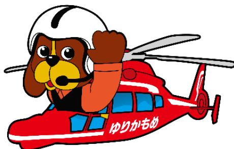
福岡市消防局マスコット キャラクター ファイ太くん

AUTHENTIC JAPAN 株式会社が開発した“ココヘリ”は、山岳地等において遭難者を早期に発見するためのサービスであり、登山者のセーフティネットとして非常に高い効果を発揮しています。特に遭難者本人が遭難したことを伝えることができない状況の場合には、遭難者の早期発見に絶大な威力を発揮します。